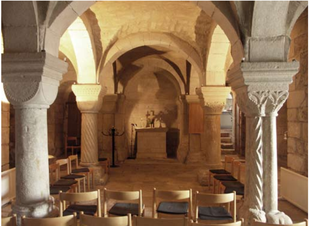
Fig. 2. Förhallen i Dalby kyrka.

sammanfattar de inledande resultaten som forskningen kommit fram till genom detta arbete.