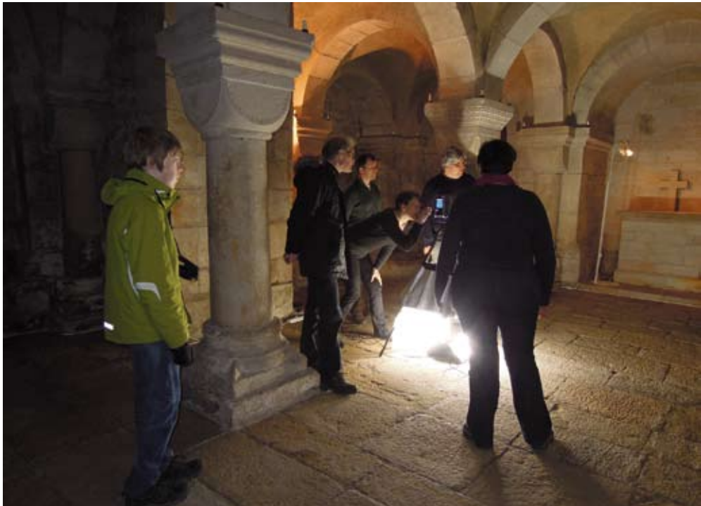
Fig. 4. Scanningen av förhallen i Dalby. Foto Bodil Petersson, april 2012.

Hypotesen är alltså att dopfunten under äldre medeltiden varit placerad i förhallen. Frågan är nu om man med hjälp av en 3D modell kan komma ett steg längre när det gäller att utvärdera hur pass sannolikt detta är. Det är viktigt att hålla i minnet att en virtuell tolkning är en sammanställning av kombinerad och fragmenterad information, och att det är av det skälet som det inte skapas någon exakt replika av den historiska miljön. Det har dock