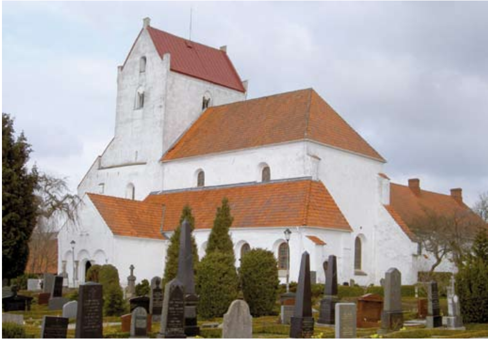
Fig. 1. Dalby i Skåne, Sverige. Foto Jes Wienberg, april 2010.

staka år, tills denna status överfördes till den kända domkyrkan i Lund. Detta kan förklara Dalby kyrkas stora basilika från 1000-talet, medan förhallen och funten tillhör tiden efter biskopssätet. Det så kallade kungapalatset kan ha varit palats för (ärke)biskopen eller klosterbyggnader. Dalby hade aldrig något benediktinerkloster. Konventets troligen 12 kaniker tog del i den gradvisa etableringen av augustinerorden. Harald Hen blev troligen begravd i långhuset framför Heliga korset under en ljuskrona som avbildade det Himmelska Jerusalem. Fragment av ljuskronan har återupptäckts bland fynd från tidigare utgrävningar. Jaktparken måste inte vara kunglig eftersom även kloster kunde ha jakt-parker. Dalbyboken kan inte ha skrivits i Dalby, utan är troligen från Hamburg-Bremen, och har kanske anlänt tillsammans med biskop Egino. Den norra delen av Dalby, kallat »Norrby», kan ha varit en liten stad