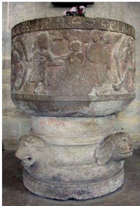
Fig. 3. Dopfunten i Dalby.

Dopfunten i Dalby är i flera avseenden ett exceptionellt arbete (fig. 3). Den har tillverkats av skickliga stenhuggare med kännedom om den internationella romanikens form-