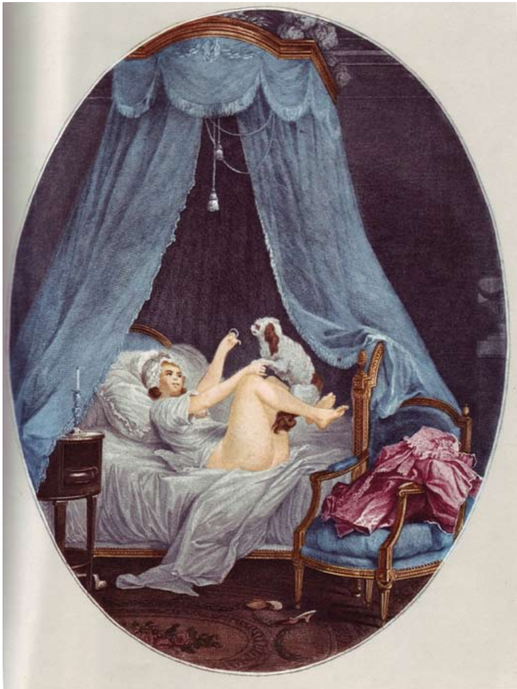
4. Jean Baptiste Chapuy (1760–1802), Le joli chien , after original av Niclas Lafrensen d.y. (1737–1807).