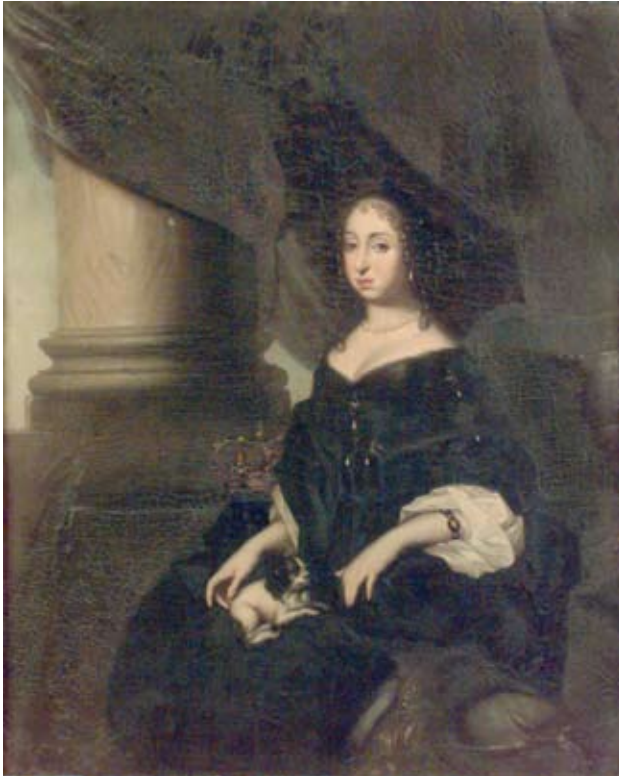
2. David Klöcker Ehrenstrahl, porträtt av änkedrottning Hedvig Eleonora (1636–1715) med knähund.