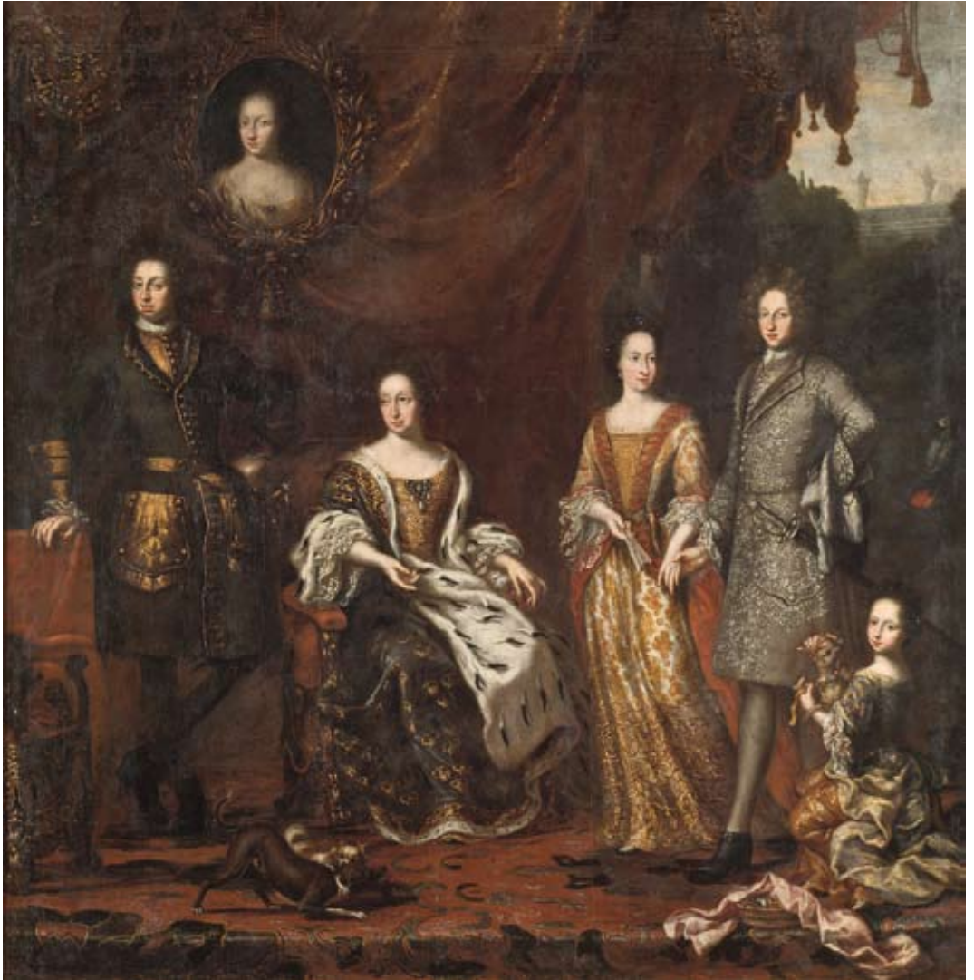
5. David Klöcker Ehrenstrahl (tillskriven), Karl XI, konung av Sverige, med familj (1697) Ulrika Eleonora d.y. håller en knähund i famnen och till höger om den blivande Karl XII sitter en papegoja.