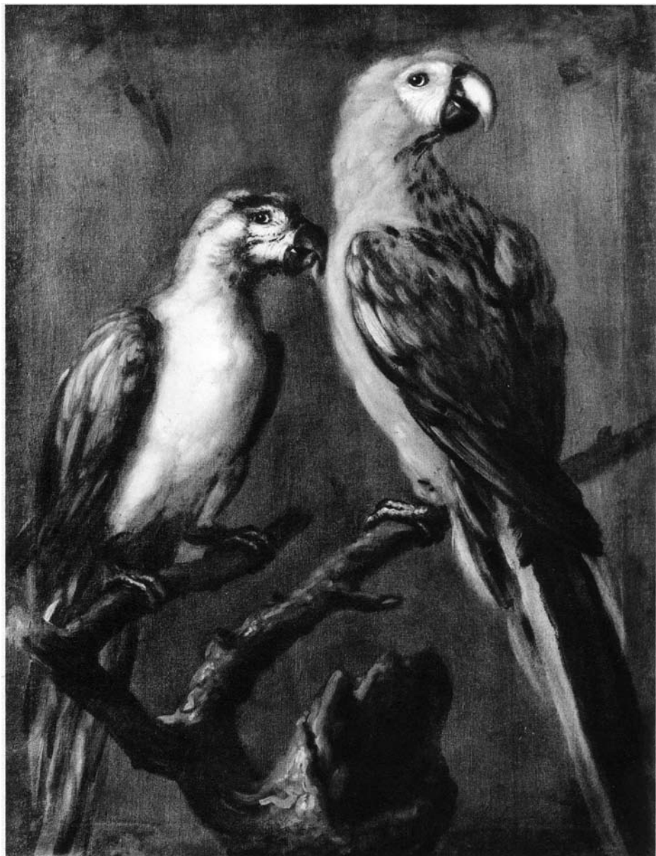
David Klöcker Ehrenstrahl, Två papegojor (ca 1696).