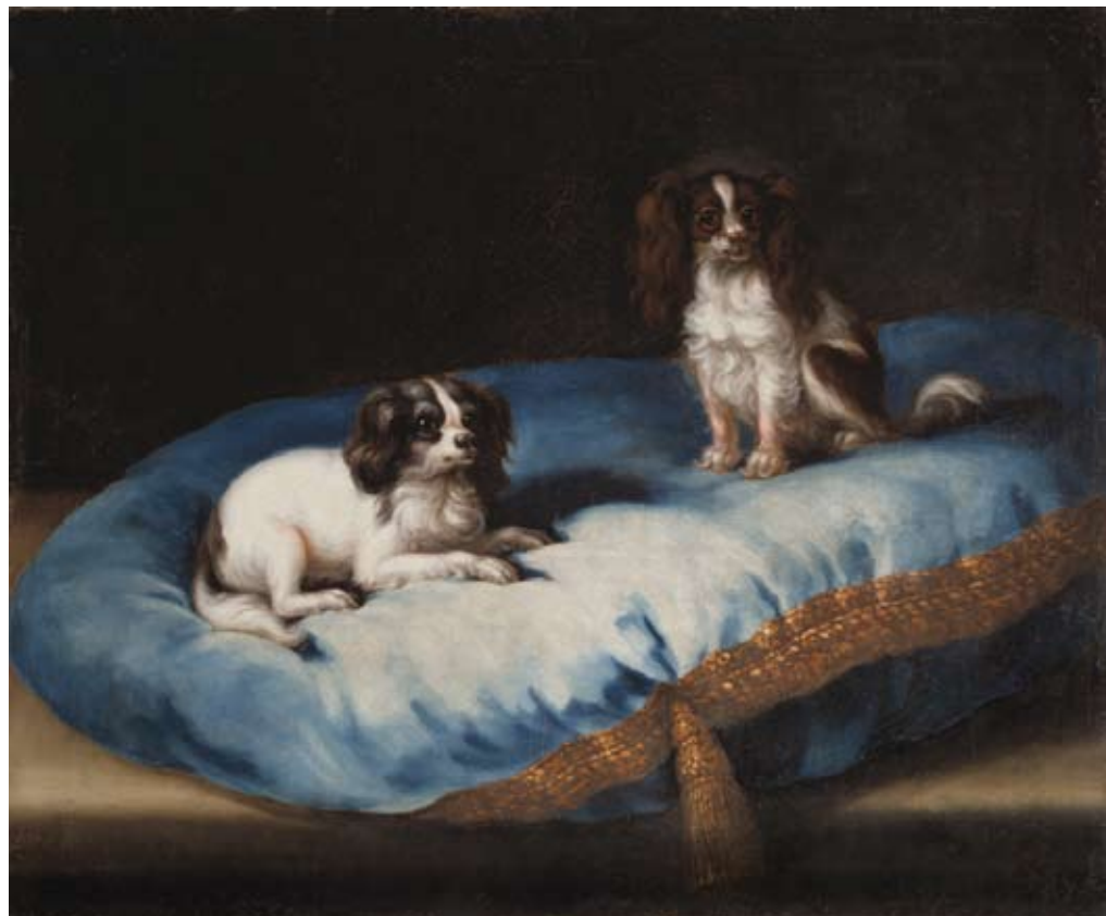
3. David Klöcker Ehrenstrahl (tillskriven), Don-Don och Nespelina .