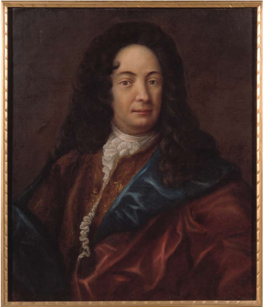
5. Ludwig Weyandt, porträtt av Olof Hermelin (1658–1709).