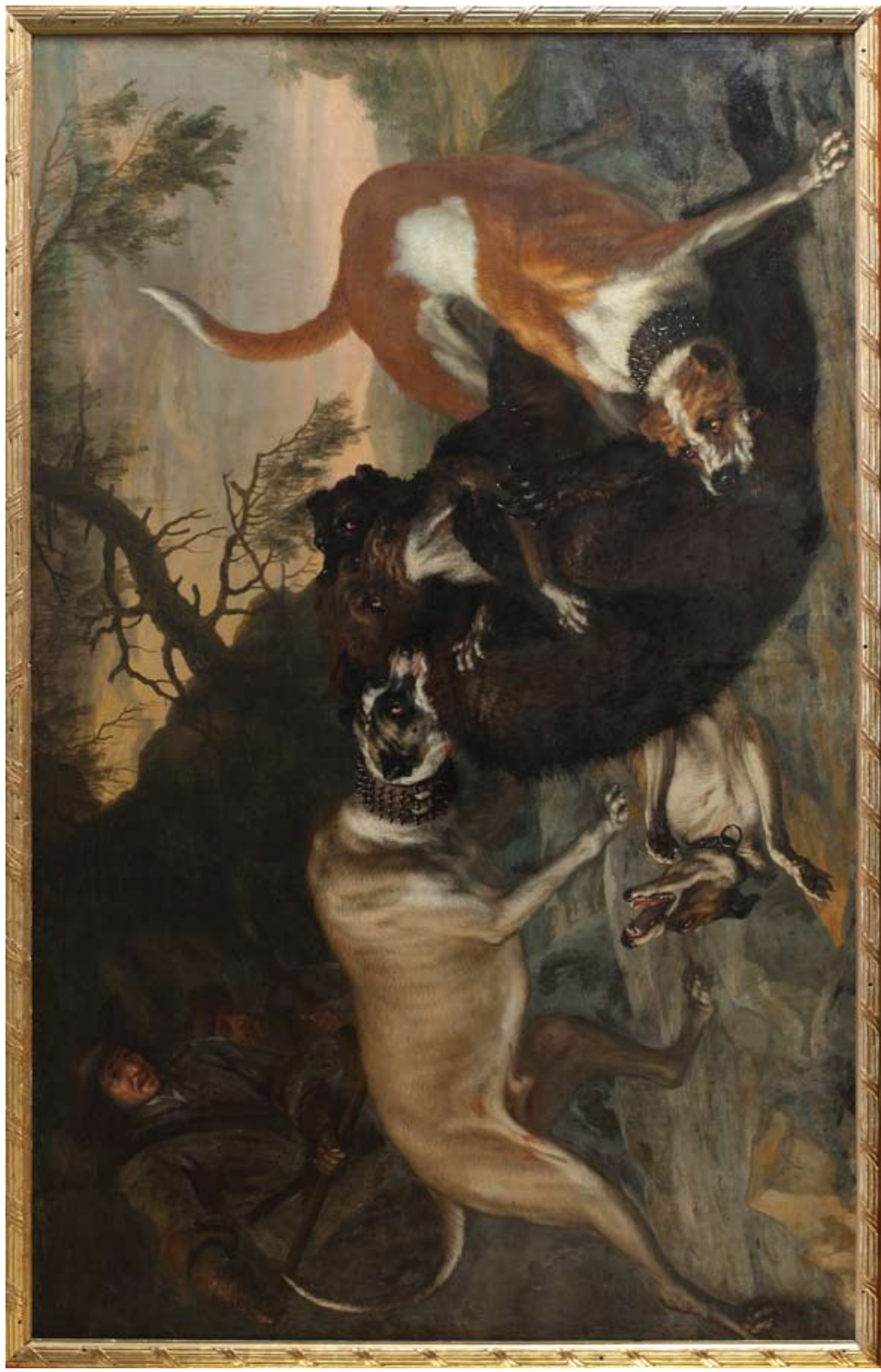
8. David Klöcker Ehrenstrahl, Björn i kamp med fyra av Karl XI:s hundar (1674).