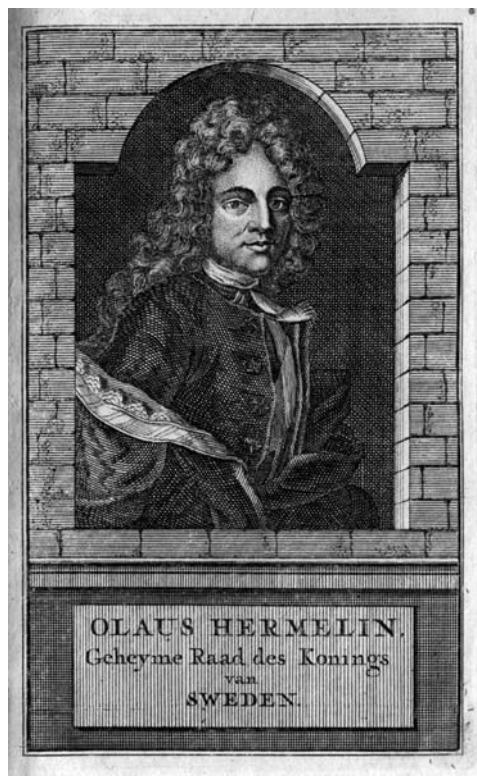
Olof Hermelin, kopparstick av okänd konstnär; ur H. P. de Limiers, Histoire de Suede sous le regne de Charles XII (1721).

Den ena av Hermelins Pompedikter är således det ovan diskuterade epitafiet i Keyßlers reseskildring. Den andra är epitafiet i Olof Celsius' samling i UUB, som på ett par punkter avviker något från manuskriptet i Fryxellska handkriftssamlingen. Där heter det till exempel i rad två: "Illius & felix appetit ante pedes", 'Han dog lycklig framför kungens fötter', inte "illius & tandem mortuus ante pedes", 'Han dog till slut framför kungens fötter' (mina kursiveringar). I Celsius-handskriften används appetit och i Fryxell-handskriften mortuus , som båda är imperfektum av 'dö'. Uttrycket oppeto mortem har innebörden 'gå i döden' och används ibland i betydelsen 'gå i döden på