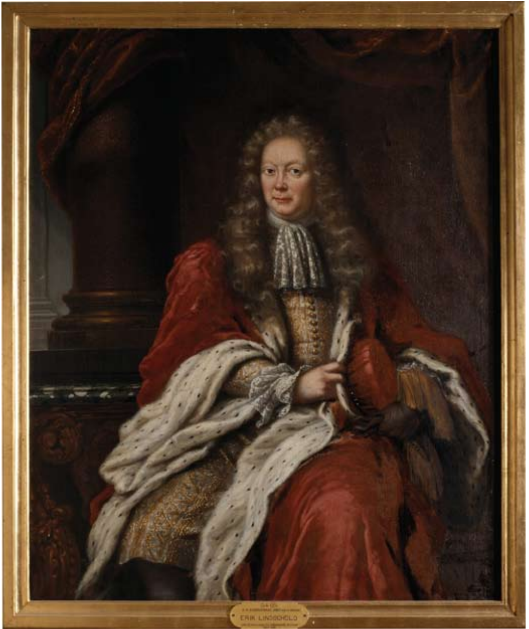
1. Porträtt av Erik Lindschöld (1634–1690). Målning utförd 1690 av hovmålare David Klöcker Ehrenstrahl (1628–1698).