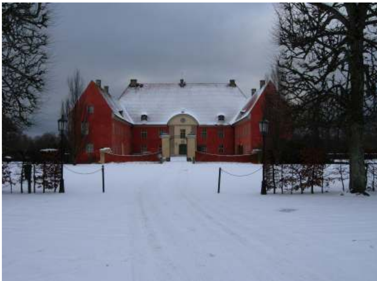
Figur 2. Bror Emil Hildebrand anlände till Krapperup en januaridag 1828. Då hade borgens fasader en annan kulör, men i övrigt var nog stämningen ungefär densamma som en vinterdag på 2000-talet; tyst, lite ödsligt och stilla.

och olika lagerbyggnader, och anläggningar som fördämningar, dammar och kanaler, se figur 3.