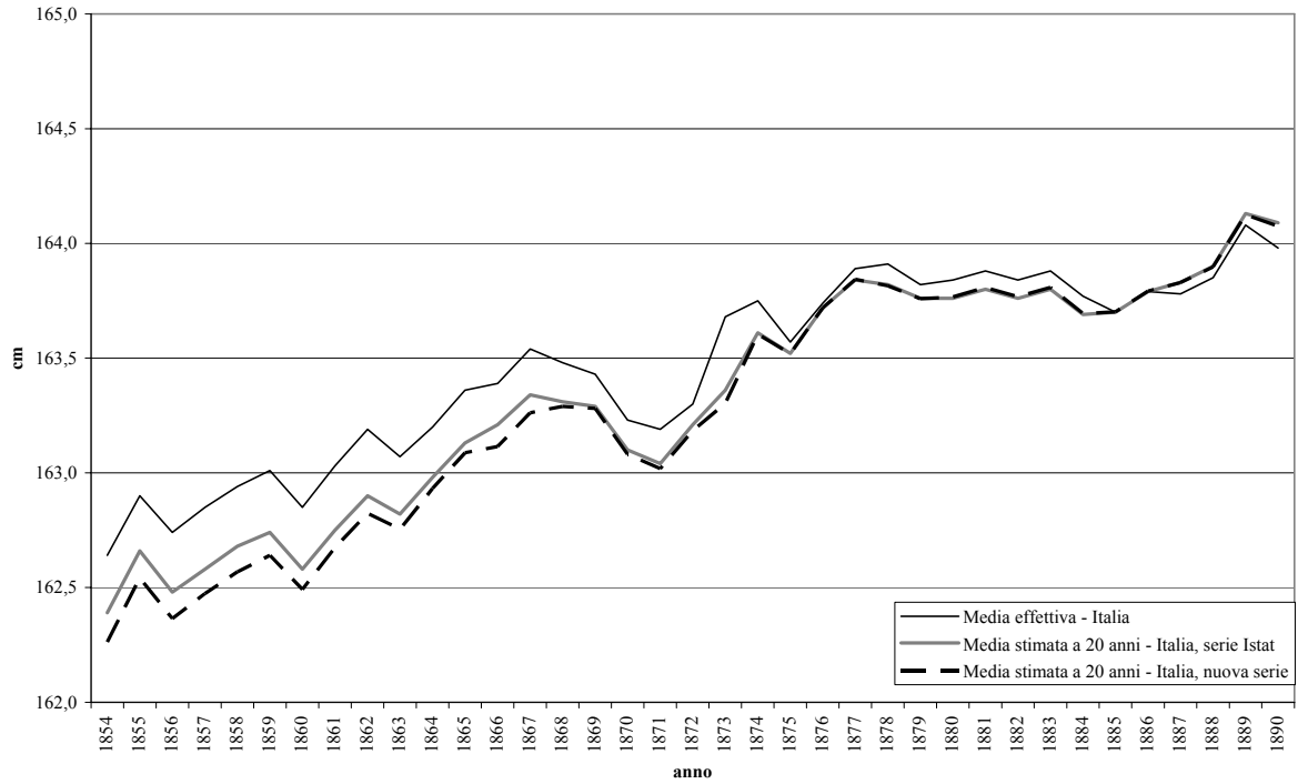
Fig. 4. Statura dei coscritti italiani reale e stimata a 21 anni di età con diversi metodi (classi 1854-1890)