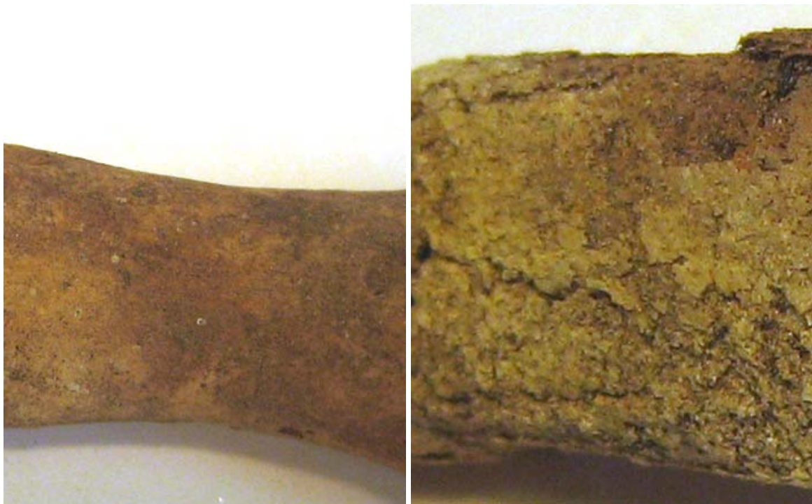
Fig.2. T.v. förstörd bild av en första falang från ett vuxet djur. T.h. förstörd bild av ett skenben från ett ungdjur. Notera den stora skillnaden i ytskiktets bevarande.

Rent visuellt framgår denna skillnad tydligt då man tittar på de båda kategorierna bredvid varandra.