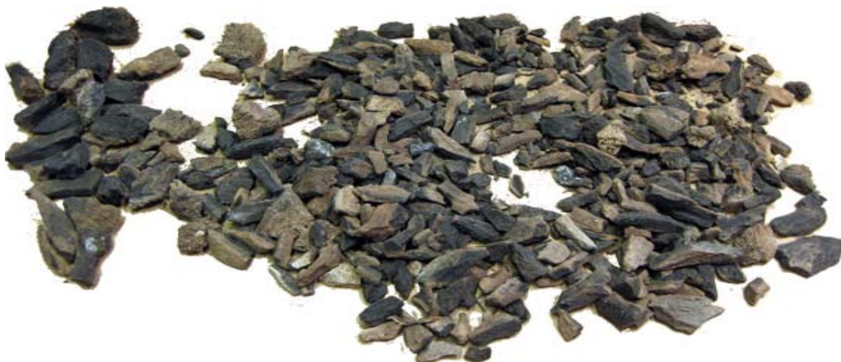
Figur 2 Urval av svedda hornfragment från kontext B3

bestämmas uppvisar exakt samma struktur som de bestämbara men är för små för att man ska kunna få en helhet i formen. I de fall ytskiktet är bevarat påminner de mycket om älg och kronhjort men har en för skrovlig yta för att kunna härstamma från ren.