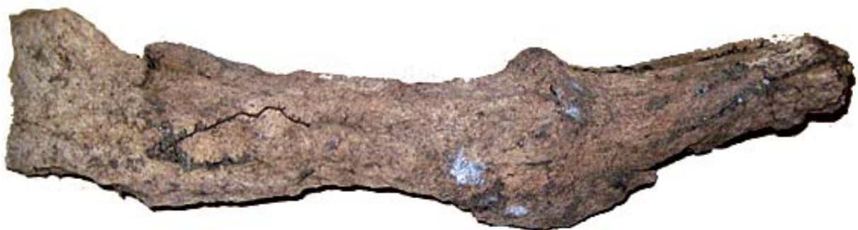
Fig. 6 Vänster del av pannbenet (os frontale) med skallfast horn (cornu) från Älg (Alces alces).