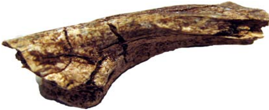
Fig. 2. Del av underkäke.