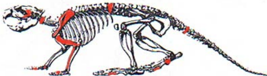
Fig. 2. Elementrepresentation för Bäver ( Castor fiber ).

Bäver är representerad med 13 benfragment med en totalvikt på 6,3 g. Bäverbenen är samtliga brända och har ungefär samma färg som människobenen i graven. Ben från olika delar av kroppen finns representerade i material, vilket kan indikera att en hel kropp ursprungligen funnits närvarande, se figur 2 nedan. Flest fragment kommer från tåben varav ett gått att bestämma till framben och ett till bakben medan två tåbensfragment inte gått att bestämma närmre. I övrigt finns tinningbenet, andra halskotan, skulderblad, överarmsben, strålben, ett carpalben, en kota, en svanskota samt ett tarsalben representerat av ett fragment vardera. Inga ben överlappar varandra, vilket gör att det minsta antalet individer som kan påvisas även för bäver är en individ. Inga könsindikerande fragment förekommer. Däremot finns två benfragment som kan ge en åldersindelning, ett fragment av ett sammanväxt handlovsben ( Os carpi accessorium ) samt ett fragment av en ännu icke sammanväxt kota. Accessorium växer samman mellan 2-3 år ålder. Ryggkotor hos bäver växer däremot samman mycket oregelbundet och kan ibland börja växa samman vid så hög ålder som 13 år och ibland så tidigt som 3 år. Majoriteten är dock fortfarande osammanväxta vid 4 års ålder (Fandén 2005:205). Detta innebär att bävern blev minst tre år gammal och var således vuxen och könsmogen (Ibid:212)