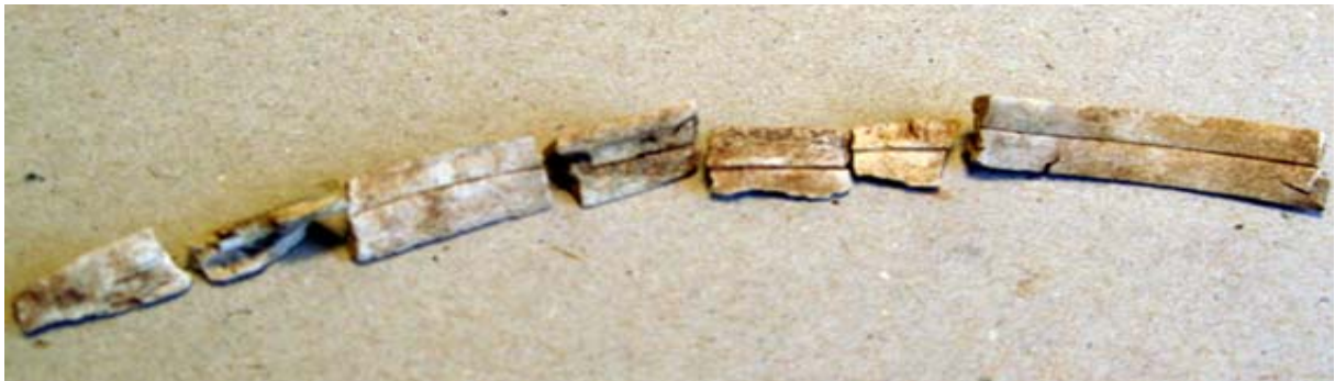
Fig. 3. Ornerade benfragment i graven

I materialet påträffades också 7 fragment av bearbetat ben. Fragmenten har liksom övrigt material utsatts för eld och blivit fullständigt brända. Fragmenten är triangulärt skurna och svagt böjda i formen och förefaller ha kommit från samma föremål. Ornamentiken består av raka längsgående skårer på en polerad yta. Det går inte att identifiera vad benen kommer ifrån för djur och det ligger utanför min förmåga att bedöma vad föremålet en gång använts till.