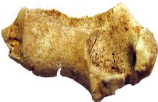
Fig. 3. Distal ledände på överarmsben (Humerus) från bäver ( Castor fiber )