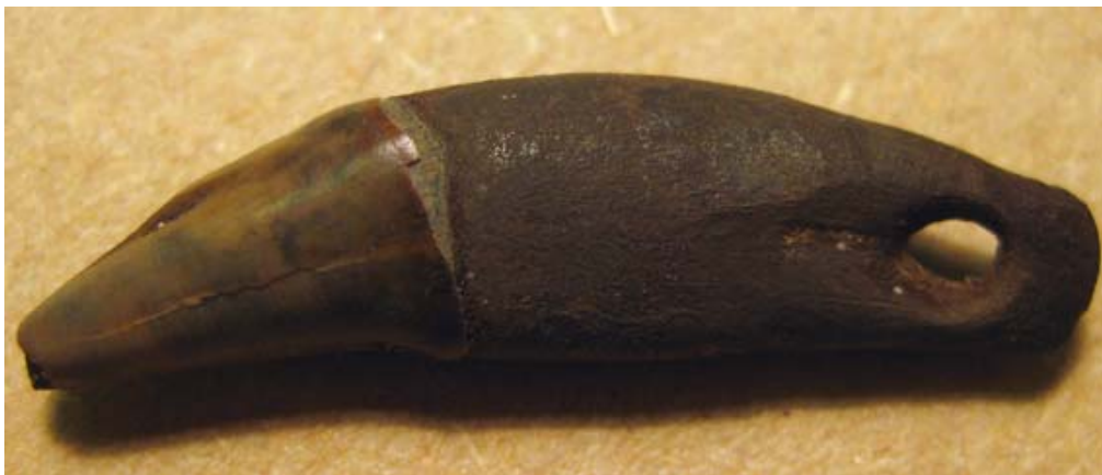
Fig. 3. Tandpärla av hörntand från vildkatt ( Felis silvestris ).

Bearbetningsspår förekommer på tre mindre fragment från tre olika lokaler, vilket skulle kunna tyda på behantverk ute i fornsjön. Ett av dess utgörs dock av ett fragment av en flinteggad benspets som då kanske inte representerar hantverk utan snarare ett skadat redskap. Förekomsten av en tandpärla tillverkad av en stor hörntand från en vildkatt är även ett intressant fynd, då detta är en typ av föremål som sällan har tappats men kan utgöra en medveten deposition.