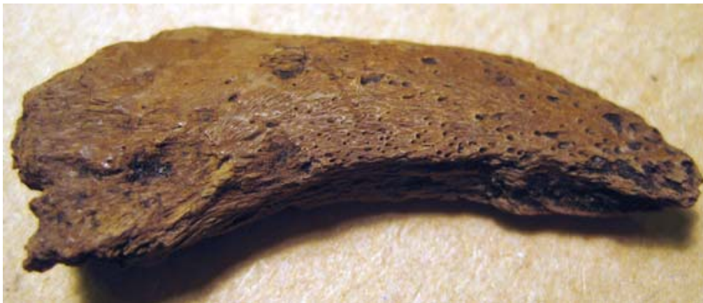
Fig. 1. Klo från brunbjörn (Ursus arctos).

Det som är slående med materialet är den stora artrikedomen trots att det rör sig om ett begränsat material. Sammanlagt elva däggdjur, fyra fågelarter och fem fiskarter har identifierats (tab. 1, 2 & 3). Visserligen är en hög förekomst av olika arter karaktäristiskt för mesolitiska boplatser, men ett slumpartat urval av knappt 400 g ben från en boplatser skulle knappast ge ett lika brett artspektra. Delvis kan detta förstås genom att materialet utgörs av 41 olika lokaler, men kan också tolkas som att lämningarna representerar lämningar efter en mängd olika aktiviteter.