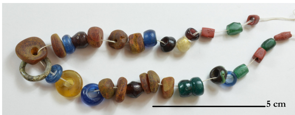
Fig. 4. Pärlorna från graven vid RAÄ Uppåkra 23, trädde i den ordning de förvaras.

en rimlig hypotes. Kedjan är ca 17 cm lång, vilket är lagom långt för en bröstkedja. Om den hängt om halsen var snodden synlig. I två brandgravar på närbelägna RAÄ 22, som undersöktes vid samma tillfälle, ska det ha funnits fyra glaspärlor, en bärnstenspärla och glaspärlefragment, men dessa verkar ha förkommit (Nagmér 1988).