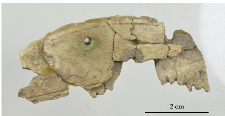
Fig. 3. Kammen från Lilla Uppåkra.

Skicket på pärlorna varierar stort, de blå och gröna är i gott skick, bland de vita varierar det, och de röda och orangea är betydligt mer nedbrutna. Det här är skillnader som ses på pärlor från många andra platser också. Den kemiska sammansättningen på det röda och orangea glaset har inte varit fullt så hållbar som på det blå och gröna.