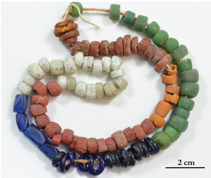
Fig. 2. Pärlorna från Lilla Uppåkra i den ordning de förvaras.

men hade hittats tillsammans med ett förmultnat skelett i en gravhög i Lilla Uppåkra (Bring & Lindfors 1848; Bruzelius 1860; LUHM 3055). Om man medvetet hade velat undersöka gravhögen eller om det var en slump framgår inte av källorna, inte heller något närmare om var den låg. Uppgiften att det överhuvudtaget rörde sig om en hög kommer från Bruzelius. Bring och Lindfors skriver bara "wid gräfning," och det kan inte uteslutas att det var en flatmarksgrav, som ju också vore mer typiskt för tiden.