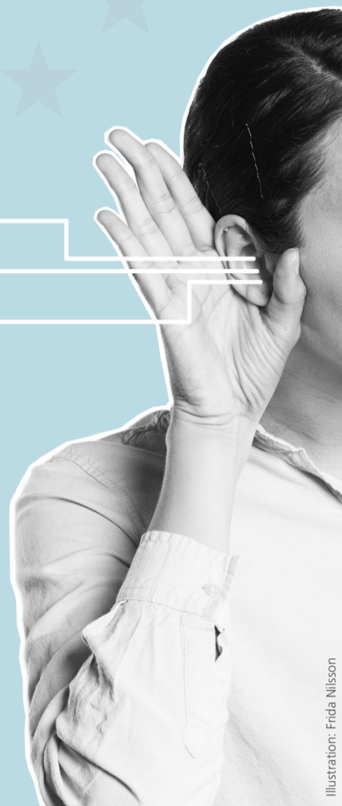
Illustration: Frida Nilsson