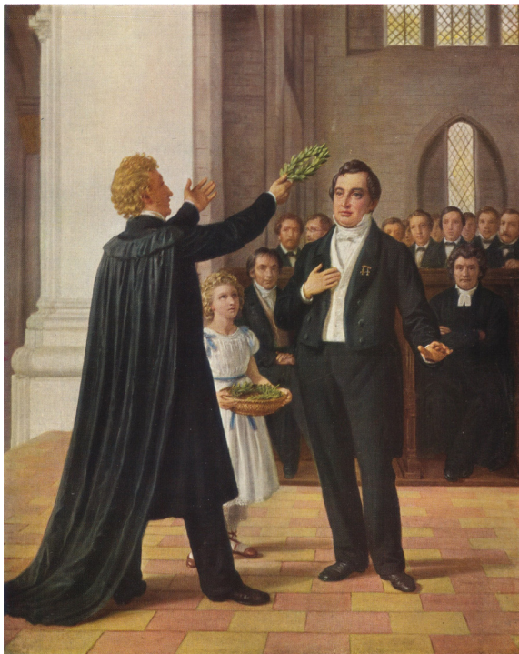
Esaias Tegnér i färd med att göra sin skaldekollega Adam Oehlenschläger till Lunds universitets troligen förste mottagare av en honoris causa -grad i modern mening. Målning av Constantin Hansen 1866.