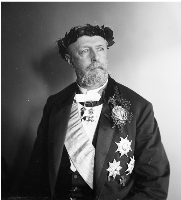
Oscar II med lundensisk hederslager runt hjässan, här dock inte vid den ursprungliga promoveringen 1868 utan fångad av lundafotografen Lina Jonn när han 25 år senare erhöll en "förnyad lager".