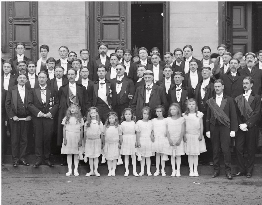
Filosofiska fakultetens nypromoverade doktorer vid universitetsjubileet 1918. Kronprins Gustaf Adolf ses strax till vänster om mitten med uppfinnaren Gustaf Dalén (i mörka glasögon) precis till höger om sig. Längst ut till vänster i den främre raden ses kapellmästaren Alfred Berg – mannen som möjligen vann sitt hedersdoktorat genom utpressning!