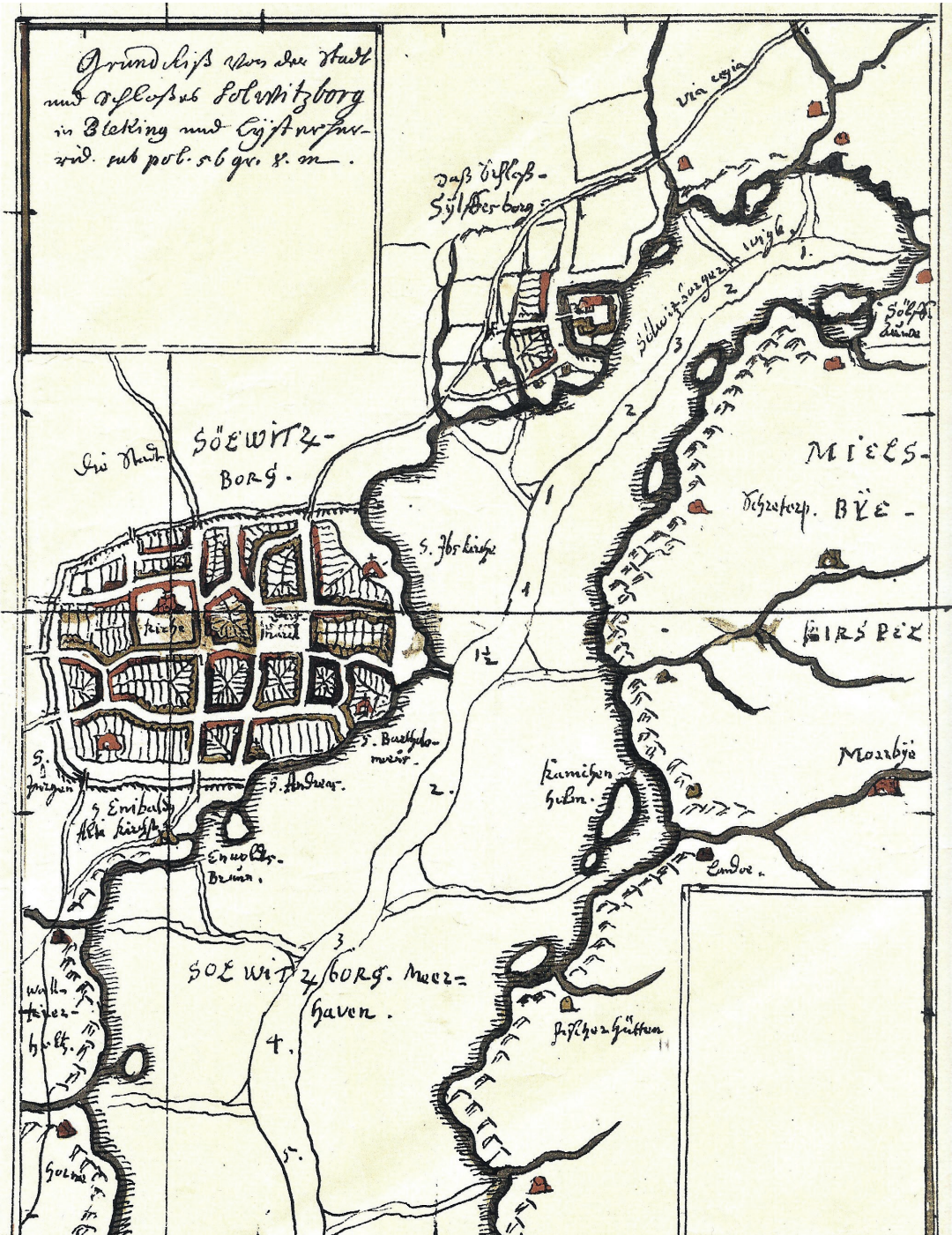
Fig. 1. Johannes Meijers karta över Sölvesborg från 1650-talet. Borgen ligger en bit norr om staden i Sölvesborgsrikens inre. Originalen förvaras på det Kongelige Bibliotek i Köpenhamn. – Map by Johannes Meijer from the 1650s. The castle is seen in the inner part of the bay, north of the town.