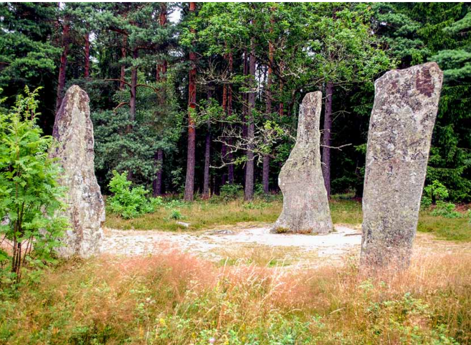
Björketorpsmonumentet som det framträder idag. Bilden tagen från söder.