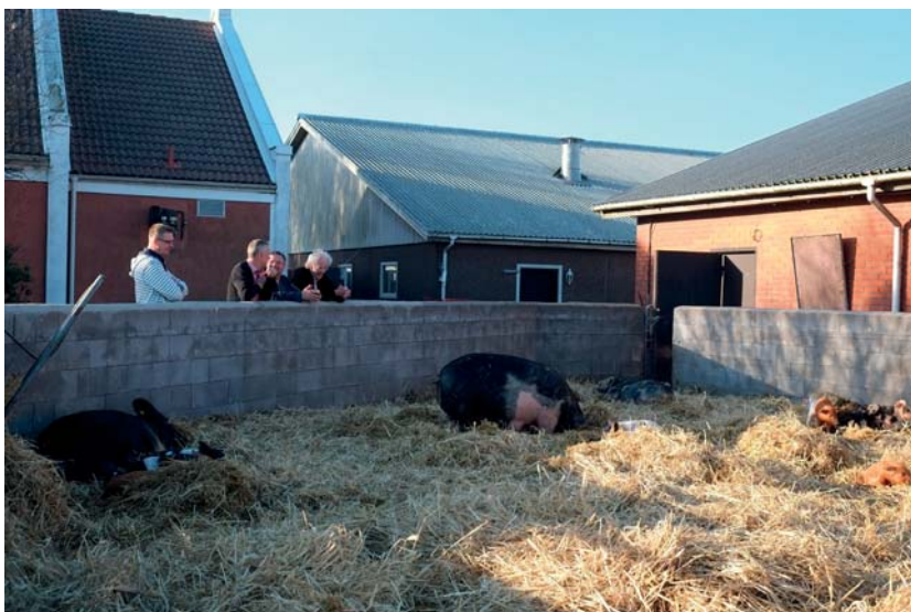
Bakom restaurangen kan besökare titta på suggor med kultingar i inhängnader.