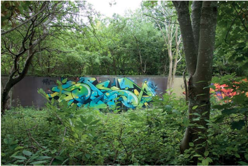
I den frodiga grönskan skymtar strukturer från tidigare industriella aktiviteter.

impediment, brownfields, periurbana landskap, mellanrum, gränzoner, efemära platser, förändringsområden (Saltzman 2009:8).