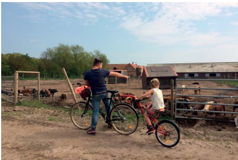
Besökare tittar på grisar i en hage belägen ett stenkast från restaurangen.