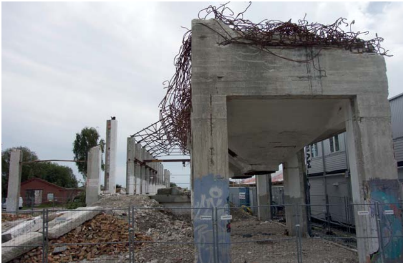
Delar av de äldre strukturerna och ruinparken. Foto: Robert Willim, 2015.

Det finns flera sätt att inom ramarna för ett samhälle bearbeta förlust och ibland ovälkommen förändring. En ruin kan spela en speciell roll i ett modernt samhälle. Den är ofta ambivalent, amorf och erbjuder genom sin mångtydighet en produktiv trop för modernitetens självmedvetenhet, som Julia Hell och Andreas Schönle uttrycker det i antologin Ruins of Modernity (2010:6). Ett annat sätt att hantera förlust och förändring är uppförandet av