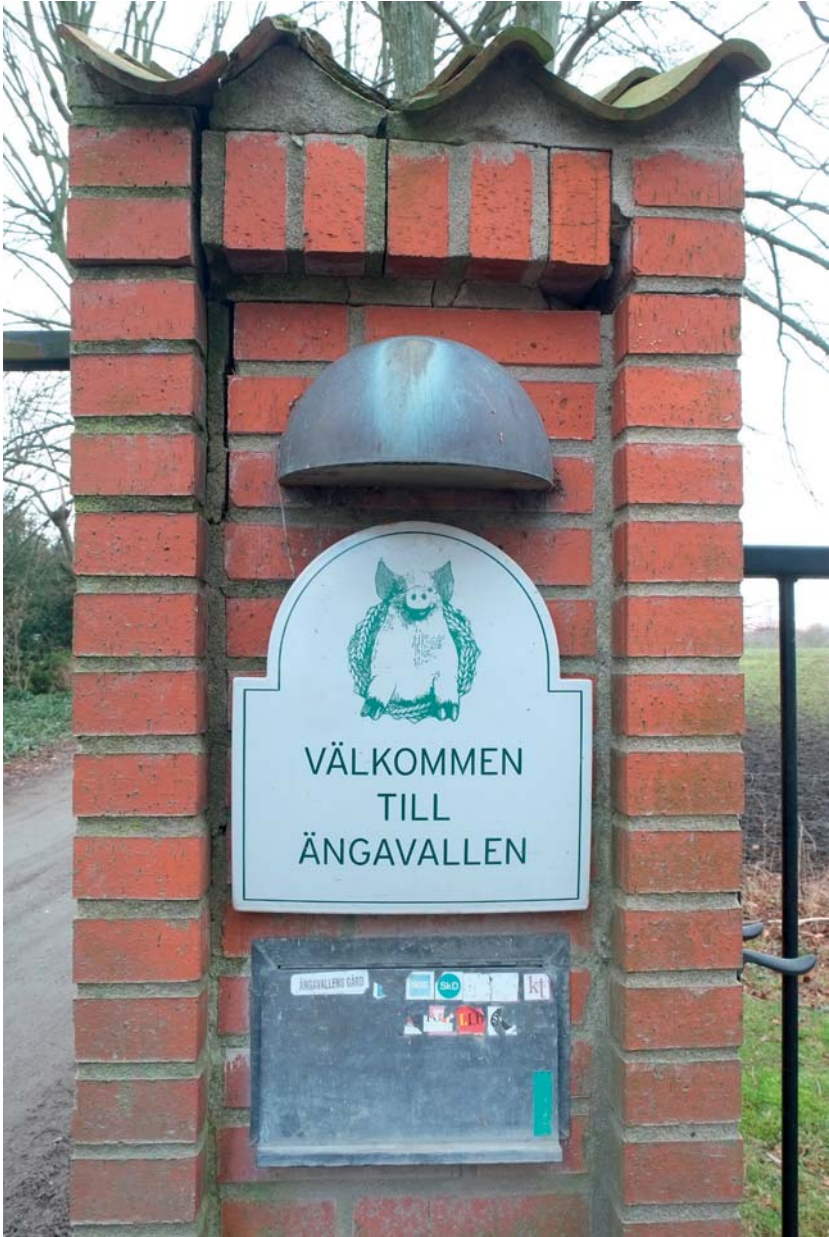
En glad gris med en kornkrans om halsen hälsar besökaren välkommen på en av gårdens grindstolpar.