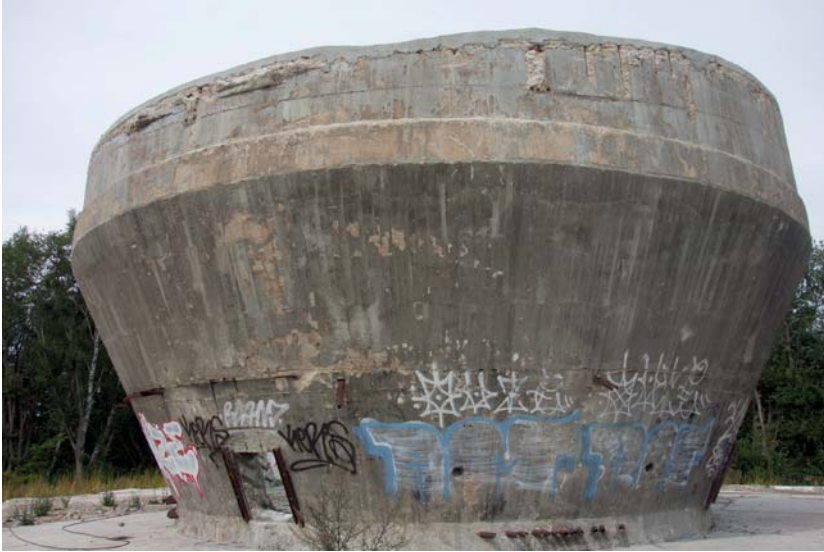
Några meter av nederdelarna till de höga silobyggnaderna har bevarats.