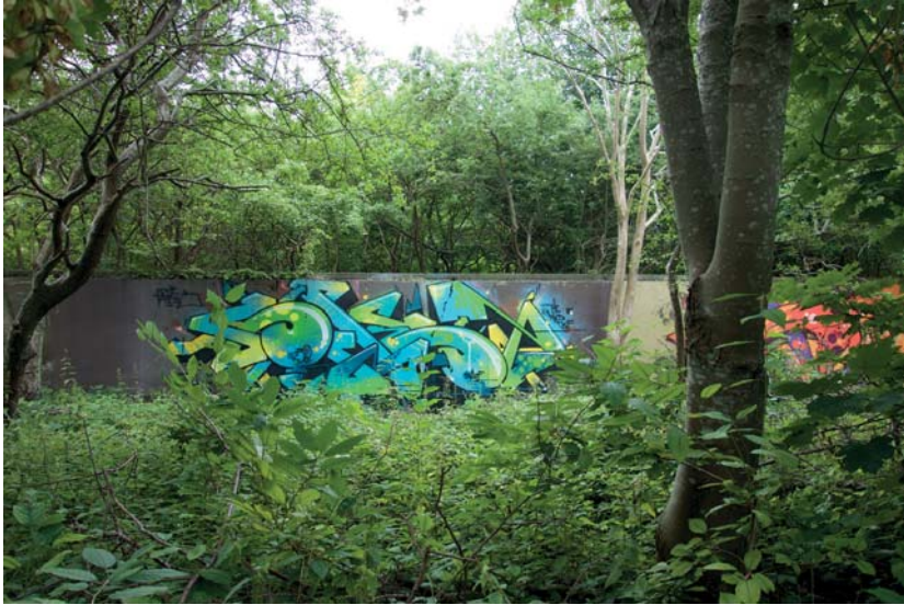
I den frodiga grönskan skymtar strukturer från tidigare industriella aktiviteter.

impediment, brownfields, periurbana landskap, mellanrum, gränzoner, efemära platser, förändringsområden (Saltzman 2009:8).