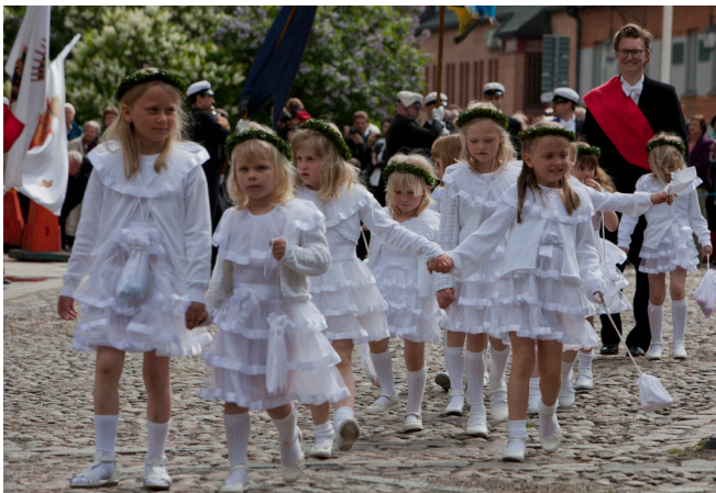
Nutida kransflickor anländer till Domkyrkan med välfyllda godispåsar i händerna alternativt säkert hängda kring halsen.

sin vanliga tjusarkonst. Då han inte kunde roa henne med annat, skrev han sitt namn på programbladet och sade: ”Detta är en autograf. Göm den till minne av farbror Esaias!” Kransflickan gjorde sin knix för den främmande tomten utan att veta, att hon hade framför sig en snillrik vetenskapsman som visste nästan allt som kan hämtas ur språkets urkunder, men ändå mer älskade blommor och barn. 54