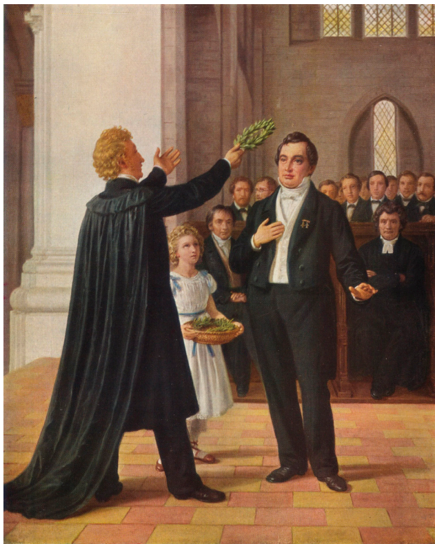
Den danske konstnären Constantin Hansens målning från 1866 föreställande den berömda promotionen i Lund 1829 då Esaias Tegnér lät lagerkröna sin danske skaldekollega Adam Oehlenschläger. Den oidentifierade lilla flickan mellan de båda diktarna torde vara en av de äldsta bilderna av en kransflicka.