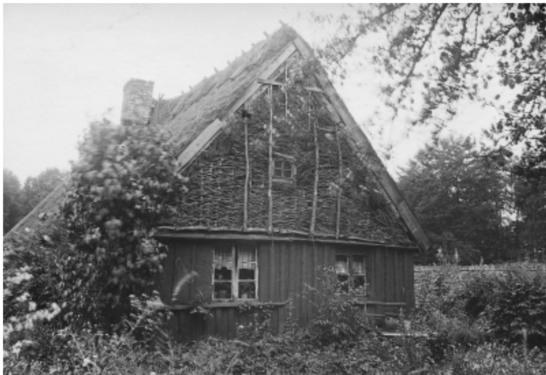
Risflätad gavel i bostadshus, "Smörhuset", Kågeröds socken 1923.

från 1928 behandlar Sjöbeck allmogebebyggelse i den skånska risbygden, kontrasterad mot slättbygdens och skogsbygdens bebyggelse. Han visar i artikeln hur de stora omvandlingarna av risbygden under 1800-talet, då stora områden nyodlades, inte bara förändrade kulturlandskapet utan också medförde att allmogens byggnader fick nya gestalter. Sjöbeck refererar också till lantmäterikartor. Sigurd Erixon ansåg dessa bristfälliga som källor vid bebyggelsehistoriska studier, eftersom det i dem inte går att utläsa de enskilda husens byggnadsteknik och byggnadstyp (Erixon 1919:1). Sjöbeck nyttjade emellertid äldre kartor över Luggude härad för att utröna i vad mån samtida 3- och 4-längade gårdar i äldre tid hade varit 2- eller 3-längade, och han kunde belägga att samtida fyrlängade gårdar till en början endast haft två eller tre längor (Sjöbeck 1928a:84).