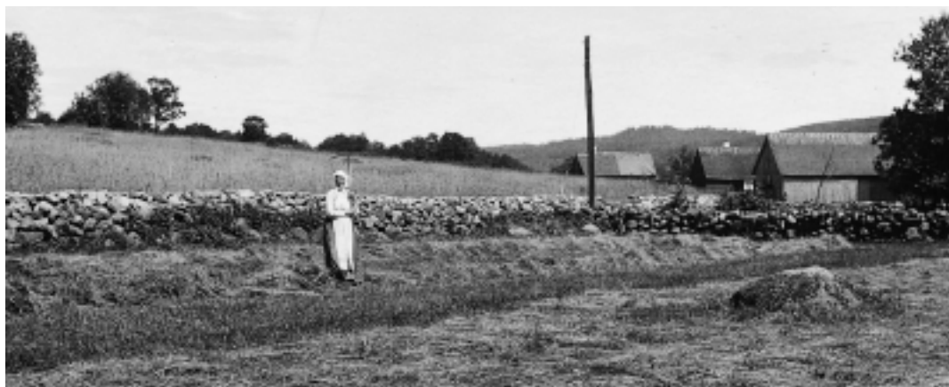
Bilden publicerad första gången 1927 med följande bildtext: Naturlig äng i Nösvala by, Brönnefjells s:n. Iförgrunden ligger höiet utbredd till torkning i sträng. I bakgrunden håller kvinnan på med "att slå ihoba en sträng" till en "soba".