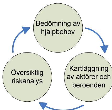
Figur 1. Tre huvudsakliga beståndsdelar i analysarbetet

Det finns ett behov av att en kommun löpande kan leda en verksamhet som syftar till att upprätthålla krisberedskap. För att bygga upp en sådan i kommunen integrerad ledande verksamhet (ett ledningssystem) kan en grund eller ram behövas utifrån vilken krissituationer kan identifieras och analyseras, mål för krishantering formuleras samt nödvändiga resurser identifieras. De exempel på angreppssätt bestående av tre huvuddelar, se figur 1, som presenterats i denna rapport skulle kunna fungera som en sådan grund eller ram.