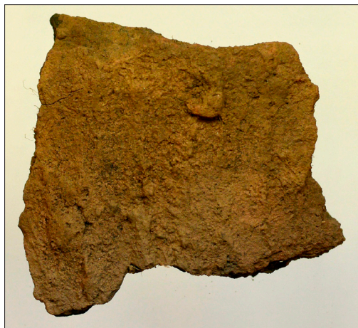
Figur 13. Keramik dekorerad med "dragna fingrar" i den rabbiga ytan från urnegrav 5.

Graven med en bottenhäll var något nedgrävd i moränen. Den påträffades i den nordöstra delen av röset. Keramik och de brända benen låg på bottenhällen. Keramikskärvorna, varav 4 bottenbitar, är av ljusbrunt, grovt magrat gods. Godset är dekorerat med vertikalt ”dragna fingrar” i den rabbiga ytan och kan dateras till den senare delen av den yngre bronsåldern (Figur 13).