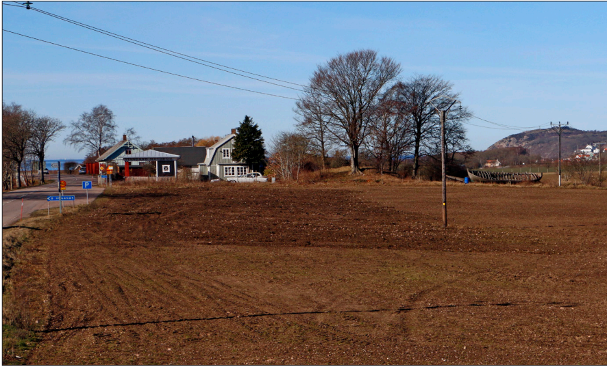
Figur 16b. Hässlehögen i Möllehässle.

tor för att konstruera graven. Gravsättningen och förslutningen av graven efter kremeringen innebar ytterligare arbetsinsatser, liksom att vårda gravområdet. Ritualerna för att gravsätta familjemedlemmar krävde ett kollektiv, som kunde fortsätta de traditionella ritualerna eller att förändra dem. Precis som idag.