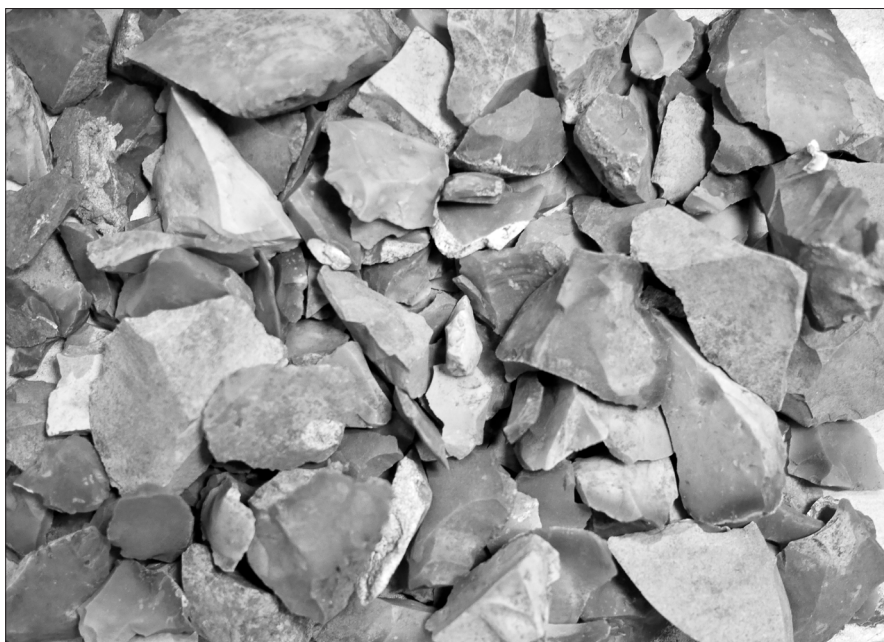
Figur 15. Flintor från röset.

Genom att återigen gräva, men i magasinet, kan vi öka kunskapen om Pangs hög. Nu kan vi säga att ett relativt stort antal människor gravlagts i detta jordblandade röset. Såväl vuxna individer som yngre och äldre barn har begravts. Endast de allra minsta, spädbarnen, har inte begravts här så att de kan återfinnas. Å andra sidan är högen skadad och våra slutsatser grundar sig på de anteckningar som gjordes under utgrävningen. Vi har bedömt att några av de bensamlingar som hittats