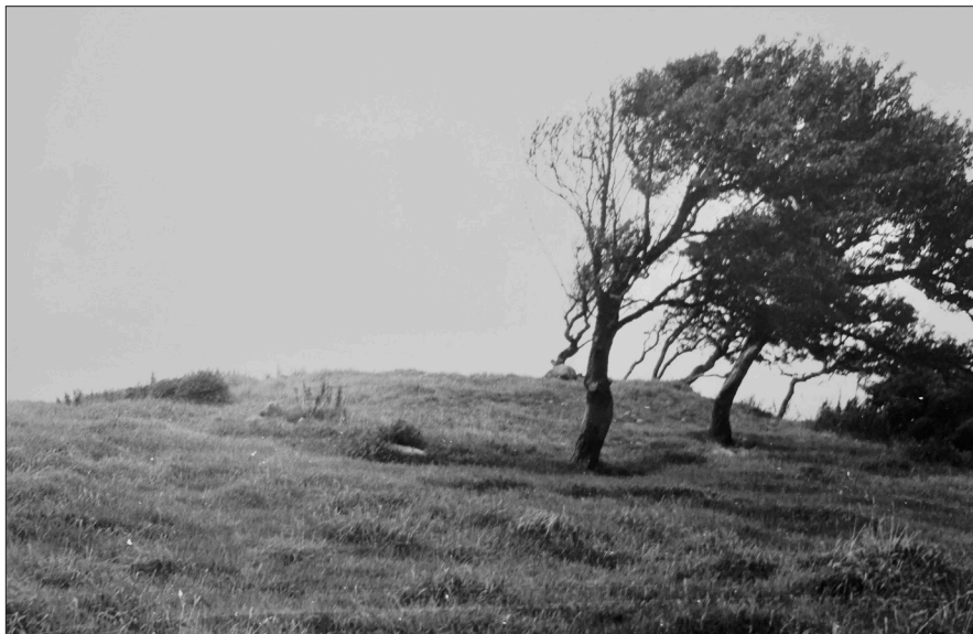
Figur 1a. Pangs hög från söder före undersökningen 1966.

Högen låg i betesmark, som hade brukats cirka 25 år tidigare. Den syntes som en svag förhöjning och den var svårt skadad av betande djur, som