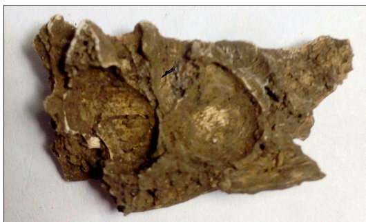
Figur 12. Bränt underkäksfragment av ett barn sannolikt från urnegrav 4. Man kan se avtryck efter både mjölkttänder och permanenta tänder (tandkronor).

Benen i ett närliggande fynd visar att där också finns delar av ett barn. På ett underkäksfragment syns att mjölkttänder varit utbildade. Alveolerna för tändernas rötter syns tydligt. Under dessa finns håligheter för hela tandkronor där två permanenta tänder börjat bildas. De ligger under två tänder med dubbla rötter. Därför bör de bildade kronorna vara P1 och P2. Individens bör därför ha dött vid 7–8 års ålder (Figur 12).