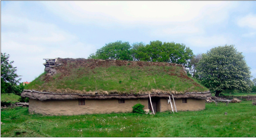
Figur 20. Rekonstruerat bronsålderhus i Boarp på Bjäre.

Vi känner inte till några hus eller gårdar från bronsåldern i Kullabygden. Det rekonstruerade huset från Boarp ger en bild av hur ett bronsålderhus kan ha sett ut (Figur 20). Från andra områden visar arkeologiska studier att det i början av bronsåldern skedde en expansion av landskapsutnyttjandet främst beroende på utökade arealer för bete. Spår efter ärgning på ursprungliga markytor under gravhögar visar att man använde årdar för att luckra upp jorden, vilket gav ett mer effektivt jordbruk. Odlingen av de tidigare vete- och kornsorterna fortsatte under bronsåldern, men nu infördes också havre, hirs och bönor.