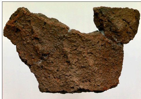
Figur 4. Rödbrun rabbig bronsålderskeramik från urnegrav 1.

Graven fanns i den sydvästra kvadranten av röset och bestod av en liten kista av flata hällar (Figur 3). I kistan fanns skärvor av ett lerkärl samt brända ben. Det fanns tre bottenbitar och flera så kallade buxskärvor samt en svagt utsvängd mynningsbit med en liten knapp strax under kanten. Godset var rödbrunt, grovt magrat med en rabbig yta med dekor av dragna fingrspår (Figur 4). Lerkäret går inte att rekonstruera, men det har karaktären av traditionell yngre bronsålderskeramik.