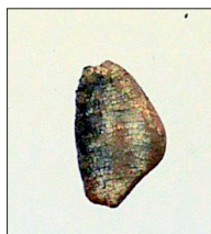
Figur 11. Tandkrona troligen från urnegrav 4. Emaljskador har uppstått vid upprepade tillfällen. Barnet har troligen drabbats av svält.

De brända benen i en fyndenhet kan föras till ett barn, som var 4–6 år gammalt. En obränd tandkrona har identifierats. Om tanden är en hörntand, vilket är troligt, är barnet minst cirka 6 år, eftersom tandkronan är färdigbildad (Figur 11). 5 Också förekomsten av emaljhypoplasier talar för att det är en hörntand. Sådana skador, som uppstår då emaljen bildas, är ofta särskilt tydliga på permanenta hörntänder.