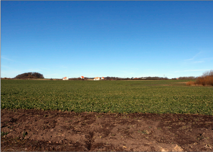
Figur 1b. Pangs hög är borta idag. Den låg strax vänster om buskaget till höger. Kullen till vänster är Lunnebjär vid Brunnby.

hade sparkat upp kanterna i framförallt den östra delen. Den var beväxt av några mindre träd och buskar (Figur 1a). Höganäs stad hade år 1957, i samband med karteringsarbete, grävt ner en triangelpunkt i högens topp. Högen undersöktes under sensommaren och hösten 1966 av arkeologer från den arkeologiska institutionen i Lund. 3