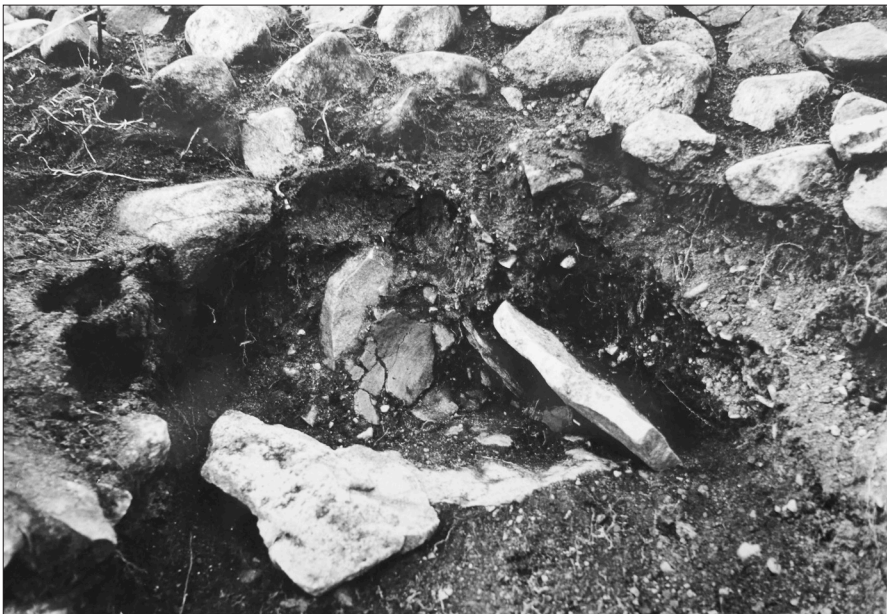
Figur 10. Urnegrav 4 vid utgrävningen.

Graven låg i kanten av den nordöstra delen av röset. Den bestod av en kista med delvis bevarade sidohällar och en bottenhäll, som var något nedgrävd i moränen (Figur 10). Kistan var invändigt sotfärgad och innehöll brända ben och keramikskärvor. Skärvorna, varav en mynningsbit, är av rödbränt gods, grovt magrat och har en rabbig yta. Keramiken kan även i denna grav dateras till den senare delen av yngre bronsåldern.