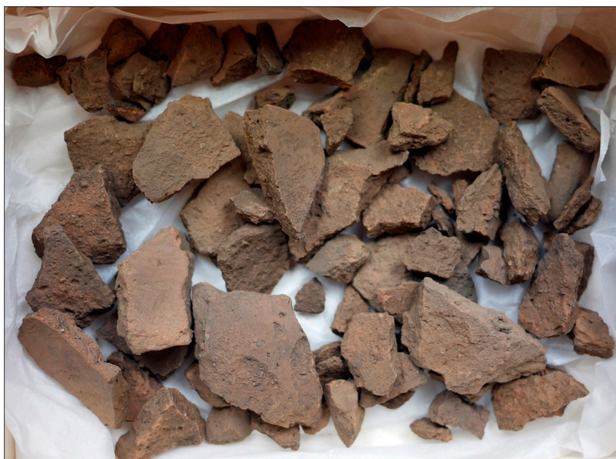
Figur 7. Skärvor av från det kraftigt fragmenterade lerkärllet i urnegrav 2.