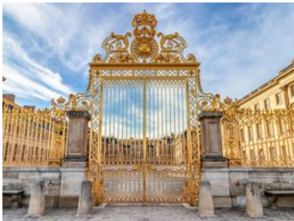
Varje år lockas miljontals turister till slottet i Versailles.