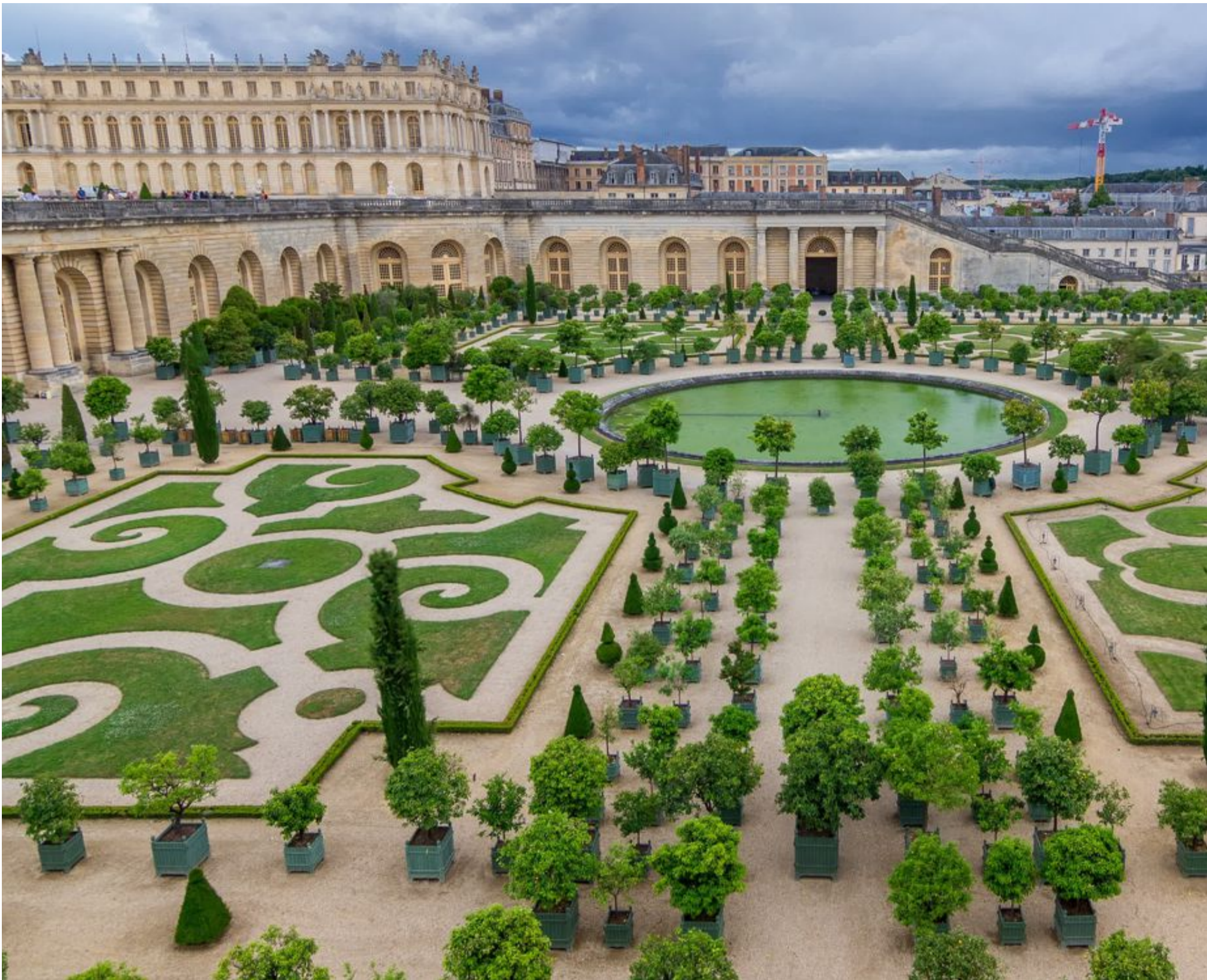
Versailles ingår i Unescos världsarvslista.