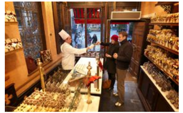
Olika slags choklad- och pralinupplevelser gör sig i Flandern.