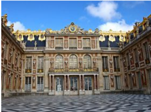
Det kan vara en god idé att planera sin vistelse väl för att få ut mesta möjliga av sitt besök i Versailles. Slottet är ett oerhört populärt besöksmål