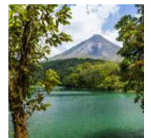
Vulkanen Arenal Volcano i Costa Rica.

från fuktigt och tropiskt vid de karibiska stränderna till torrare och solsäkrare på Stillhavssidan. Här finns många ekovänliga hotell och man strävar efter att bli det första koldioxidneutrala landet i världen.