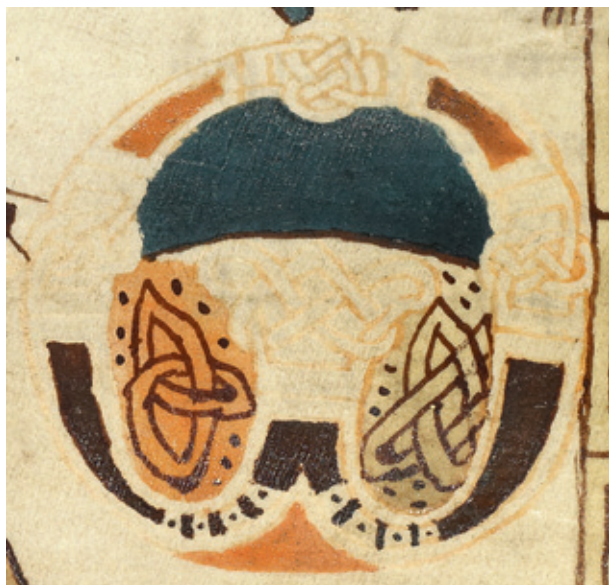
Fig. 2. GkS 1325 4°, f. 130v. Lukasevangeliets Q-initial.

pas även i den utmärkta katalogen över Det Kongelige Biblioteks medeltida handskrifter 1926. 5