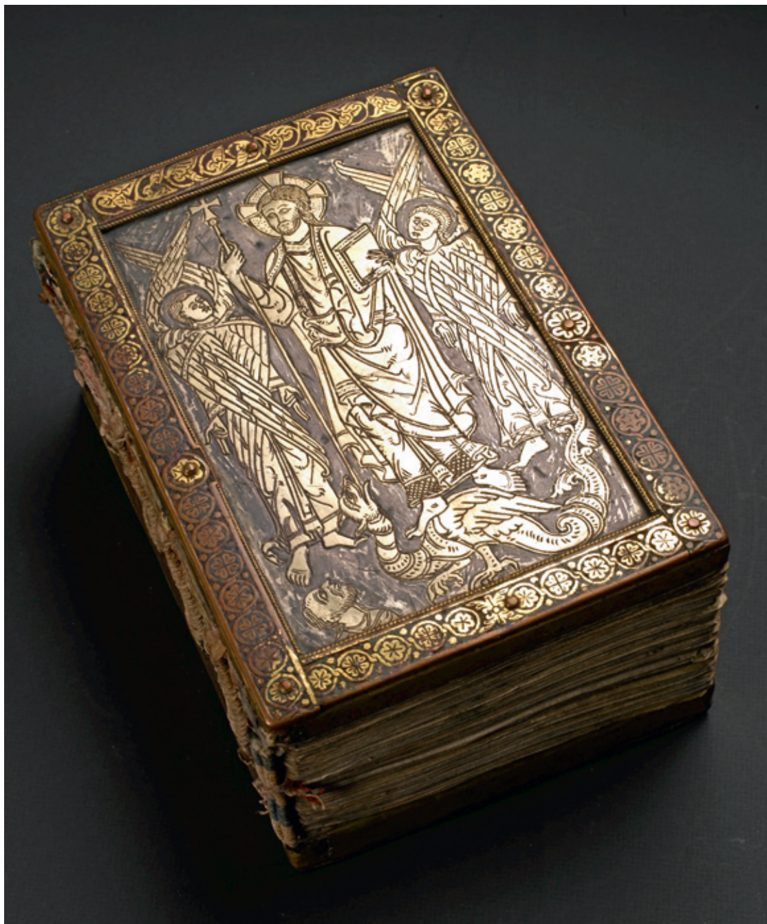
Fig. 4 a-b. GkS 1325 4°, bandets främre respektive bakre pärm. Foto Helle Brünnich Pedersen, 2012.