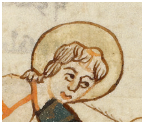
Fig. 3 a–b. GkS 1325 4°, f. 26v & 84v. Matteus- och Markusevangelisternas diadem. Foto Helle Brünnich Pedersen, 2012.

Dalbyboken som ofullbordad, och går tillbaka till illuminatörens första arbetsfas, framstår de tomma ytorna under Matteus- och Markusfigurerna liksom ovanför Lukas- och Johannesfigurerna som uppenbart sparade för den saknade texten. Exempel på denna layout var särskilt ofta förekommande i handskrifter från Corvey alltsedan 900-talet, men även evangeliarier från Köln omkring år 1050 uppvisar samma struktur. 18 Med tanke på att samtliga explicit- och incipitsidor med monumental kapitälskrift är utförda i bläck och de inledande raderna på evangeliernas rectosidor är markerade med röd och brun rustik kapitälskrift, kan man utgå från att den inledande, och nu felande, evangelietexten skulle upplåtas till illuminatören att fullborda. Ett rimligt antagande vore att dessa var avsedda att förgyllas, men eftersom det momentet aldrig utfördes, och bokstäverna förutom initialerna antagligen inte varit avsedda att vara ornamenterade, så finns det heller ingen anledning att efterlysa någon underliggande skiss. 19