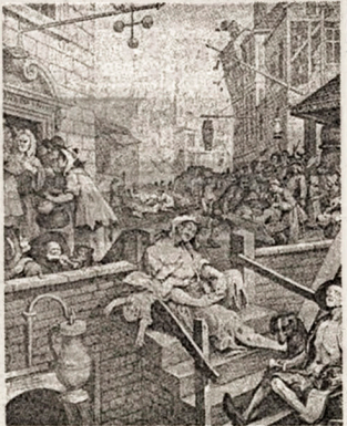
Som ung präst upplevde Malthus de fattiga djupa misärerna i den begynnande industrialismen i England. Han greps av fasa inför fattigdomen och dess råber och de undertryckta hat. Övan ett stick av William Hogarth från industrialismens genombrottsid, "Björningsgrändem".

Den katolska kyrkan har samma kalkyl som de ortodoxa marx-