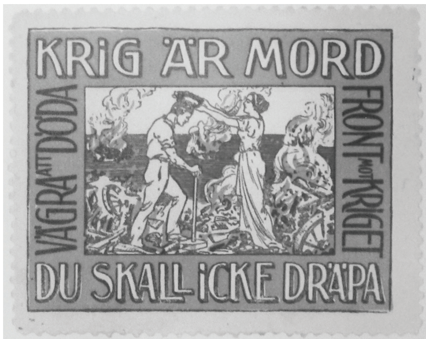
Bild 5. Antimilitaristiskt brevmarke utgivet av den ungsocialistiska militärkommittén 1914.

målmedvetne man, med den röda lagerkransen, socialismens och fredens segertecken”. 217 Även om den antimilitaristiska kampen måste föras med alla tillgängliga medel, var värnpliktsvägran tveklöst det mest beundransvärda.