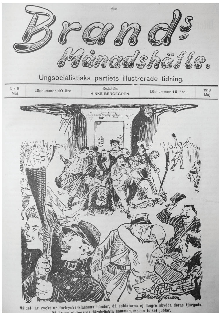
Bild 6. "Våldet är ryckt ur förtryckarklassens händer, då soldaterna ej längre skydda deras tjuv gods. Då krypa nidingarna förskräckta samman, medan folket jublar"... Brands Månadshäfte , Nr: 5 Maj 1913.

i Nya Folkviljan , insåg en skadad värnpliktig att militarismens odjur måste krossas. Med orden "Jag skall häda! Jag skall smäda!" förklarade han också att han inte längre var en parlamentarisk utan en revolutionär socialist. 303 Fräckheten och oräddheten blev ett uppseendeväckande bevis på olikheten mellan det revolutionära ungdomsförbundet och det reformistiska partiet.