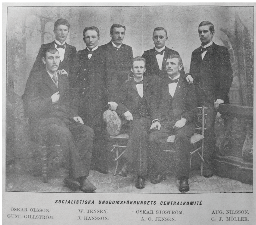
Bild 1. Socialistiska Ungdomsförbundets Centralkomité (Ungsocialisterna) år 1901 i Landskrona. Vid denna tid hade även tidningen Brand sin redaktion i staden.

alternativet till det parlamentariska arbetet. Efter den ryska revolutionen i februari samma år, hade dessutom hoppet om en svensk revolution väckts. Socialdemokraterna hänvisade däremot till fördelarna med behärskning och disciplin, vilket skulle ge en starkare förhandlingsposition. 17 Folket uppmanades att först och främst uttrycka sin vilja i höstens riksdagsval. Till viss del visade sig denna taktik framgångsrik då kravallerna avklingade och socialdemokraterna i det följande valet fick flera ministerposter i liberalen Nils Edéns regering.