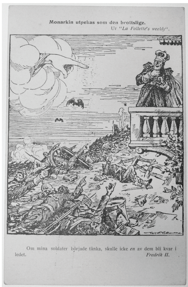
Bild 4. "Monarkin utpekas som den brottslige" ... Ungsocialistiskt vykort (odaterat).

Om du blickar in på ett slagfält, så får du se en syn, som ej med ord kan beskrivas. Din fader och broder, ja många av dina anhöriga, som du med öm känsla en gång älskat, de kanske ligga där nu och vältra sig i sitt blod och deras anleten förvridas av dödsqual. Du kanske själv har mördat dem! [...] Ty går du in i militärtjänst, strax har du svikit dina kämpande kamrater. 191