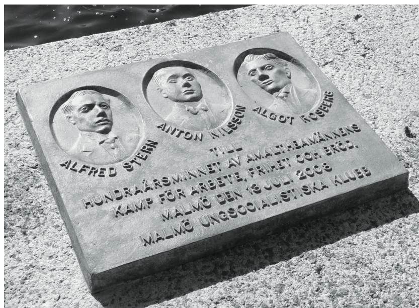
Bild C. Malmö Ungsocialistiska Klubbs plakett (som någon vecka efter fototillfället försvann) på Beijerskajen i Malmö till 100-årsminnet av "Amaltheamännens" aktion.

Det är med både glädje och stolhet som Centrum för Arbetarhistoria inom ramarna för sin skriftserie härmed publicerar Emma Hilborns undersökning av den ungsocialistiska identitetsformeringen i Skåne och Sverige. De förrådade kämparna blir därmed det andra numret av Skrifter från Centrum för Arbetarhistoria . Vår ambition med denna skriftserie är att ta ytterligare steg i arbetet med att profilera Centrum för Arbetarhistoria som ett lokalt, regionalt och nationellt centrum för kvalificerad, både bred och djup, arbetarhistorisk utbildning och forskning. Utöver detta ser vi även akademiens "tredje uppgift" som en hörnsten i vår verksamhet; vi strävar efter att kommunicera, sprida och förankra forskningsresultat och samhälls- och arbetarhistoriska perspektiv i vår omgivning. Genom skriftserien vill vi stimulera intresse och förståelse för samhällsförändring ur ett kritiskt och historiskt underifrånperspektiv.