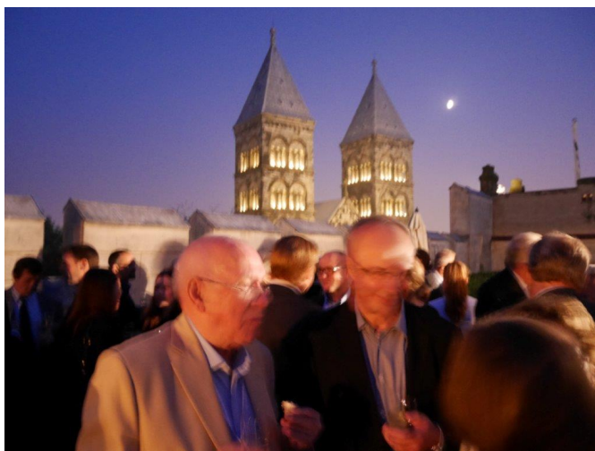
Mingel på Hypoteket med domkyrkan i bakgrunden