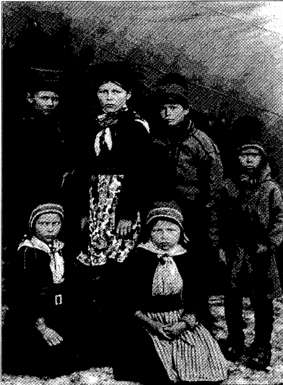
Samebarn (Rasbiologiska institutets samlingar, UUB).

belägen i Laimolahti. Under många år vistades han på ständigt resa i lappmarken, företrädesvis mellan midsommar och september. Vad det nu gällde var att ”medan tid ännu är” utforska en nomadiserande folks livsbetingelser, framför allt utreda de orsaker som gör sig gällande då ett sådant folk uppgår i ett annat, respektive försvinner. Ett tungt arbete uppe i de olika lappländska socknarna och arkiven följde. Släkttavlorna tog tid, register utarbetades, mätningarna gjordes. Syftet var en komplett genomgång av befolkningen individ för individ från början av 1700-talet och framåt. Man arbetade med hjälp av en räkneskiva, uppfunnen av Wahlund och med räknekort - sådana fanns 1928 till ett antal av 3.000, vilka skulle leda till flera