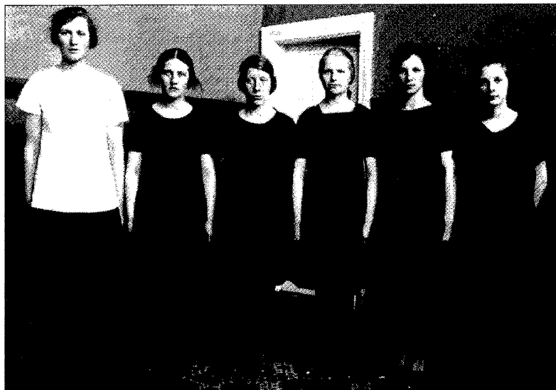
Seminarister från något av Rasbiologiska institutets mättningsbesök.