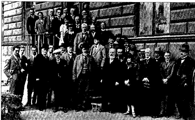
Deltagarna i nordiska konferensen för rasbiologi och antropologi i Uppsala 1925. För identifiering se not 60. (Ur Den nordiske race, 1925.)