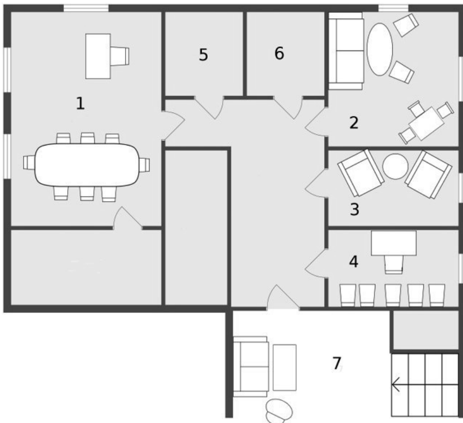
Figur 1. Skiss över det aktuella Barnahusets lokal

1. Konferensrum och kontor/samordnarens arbetsplats. 2. Vänttrum. 3. Förhörsum. 4. Medhörningsrum. 5. Kök/pentry. 6 .Läkarundersökningsrum. 7. Trapphuset.